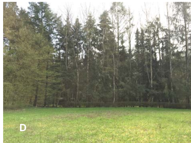
Abbildung 2: Wiese mit Blick in Richtung A: Westen, B: Norden, C: Süden, D: Süden (Kraus 2019)