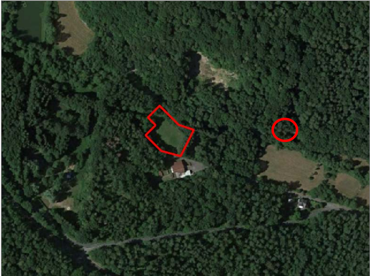
Abbildung 1: Luftbild geplante Grillhütte (rote Linie), bestehende Grillhütte (roter Kreis)

Die umliegenden Waldwege, Freiflächen mit Parkmöglichkeiten sowie der Bereich des Schützenhauses und die bestehenden Grillhütte, die rund 350 m weiter östlich liegt, werden sehr stark anthropogen zur Freizeit- und Erholungsnutzung beansprucht. Das ganze Jahr über finden sich dort Spaziergänger (auch mit Hunden), Nutzer des Schützenhauses, Jogger, Fahrradfahrer, Reiter, Wandergruppen, Geocacher etc., die zum Großteil mit dem PKW, die waldnahen Parkplätze anfahren. Zudem findet in den umliegenden Waldflächen eine intensive Forstwirtschaft statt. Aus artenschutzrechtlicher Sicht stellen die vorgenannten Nutzungen ein erkennbares und standortbedingt erhebliches Störungsniveau dar (Lärm, Licht, Bewegungen), so dass bei den vorhandenen Arten ein Gewöhnungseffekt anzunehmen ist.