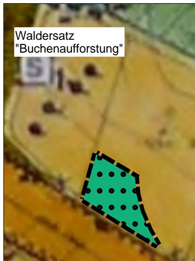
Flur 7, Flurstück 87/1 (teilweise)