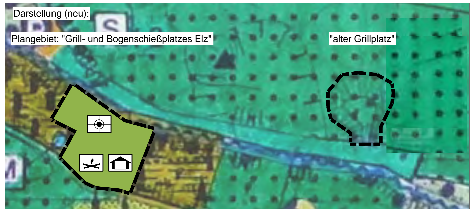
Gemarkung Elz, Flur 14, Flurstück 81 (teilweise), 82/1